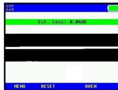
Fusión Estable Perdida de Empalme Mínima