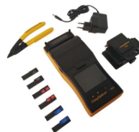
Kit de Accesorios. 3 Juegos de Holders.