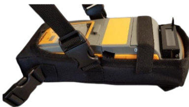
Transporte Seguro. Sujeción Rápida.