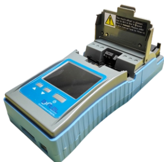
Diseño Compacto. Pantalla LCD 2.8".